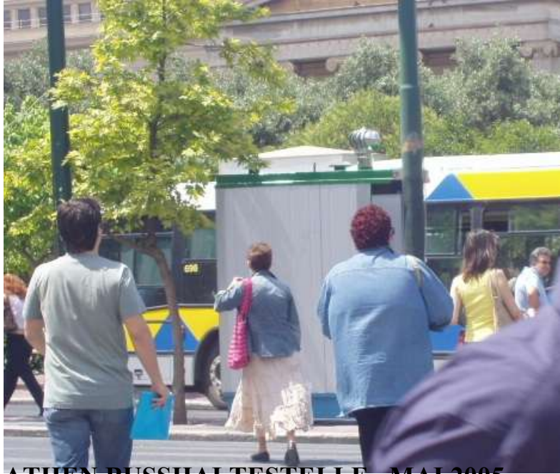
ATHEN BUSSHALTESTELLE MAI 2005

GERUCHLOS WASSER & CHEMIKALIEN FREI FÜR MINIMUM 5000 BESUCHE