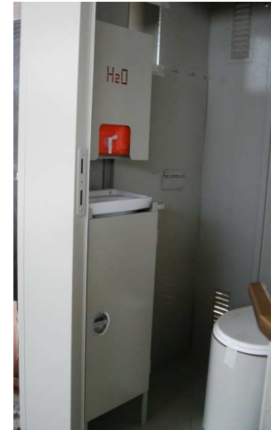
Equipped with the hand wash facility MoBa