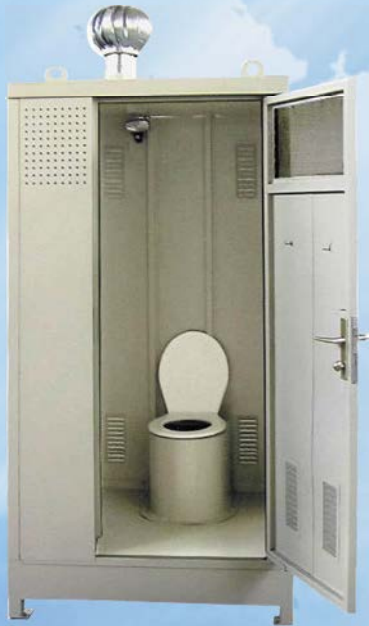
BIOWC ME EUROPE