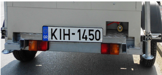
The valve for emptying the toilet

CLEANING: WITH WATER / HOUSEHOLD CLEANERS