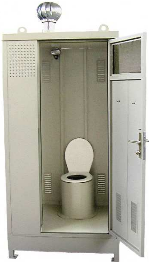
MODEL: BIOWC ME EUROPE